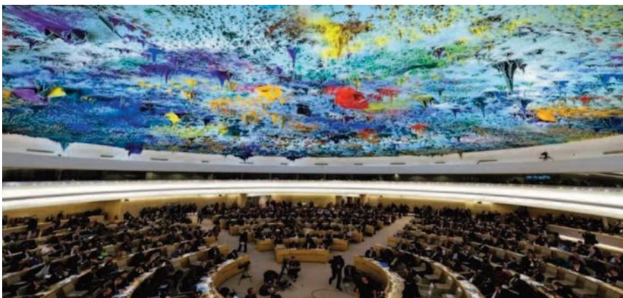
Imagen de la sede de las Naciones Unidas

Los mecanismos independientes de seguimiento se encargan de monitorear los derechos humanos a escala nacional, mientras que el Comité sobre los Derechos de las Personas con Discapacidad se encarga a nivel internacional de monitorear la implementación de la Convención.